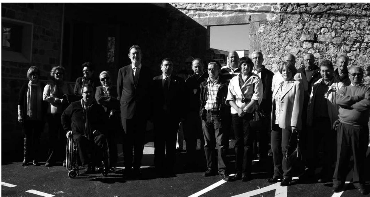
El delegado del gobierno posa junto a los asistentes al acto de inauguración

La inversión estatal del Plan E 2010, ha permitido al Ayuntamiento de Val de San Vicente desarrollar el proyecto de construcción del Tanatorio de Molleda.