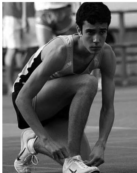
El atleta de Pesués se prepara para una prueba

Campeón Regional Juvenil de Cross Corto Campeón Regional Juvenil de Cross Largo y Escolar Campeón Regional Juvenil de Cross por Clubes Campeón Regional Juvenil de 400 metros Campeón Regional Juvenil de 800 metros Campeón Regional Juvenil de 2000 Obstáculos 7º en el Campeonato de España de P.C. (800 metros) 7º en el Campeonato de España Escolar (800 metros) 2º en el Campeonato de España al A.L. (800 metros) celebrado en Nerja en el mes de Julio Convocado para los Juegos del Cantábrico Convocado para el Torneo de Federaciones de 2ª Record de Cantabria Junior de 4 X 400 metros 52,46 en 400 metros 1:55,70 en 800 metros 4:14,3 en 1500 metros 6:21,59 en 2000 Obstáculos 11,98 en Triple Salto 3:22,22 en 4 X 400 con la Selección Cántabra Absoluta Atleta en seguimiento por la Federación Española.