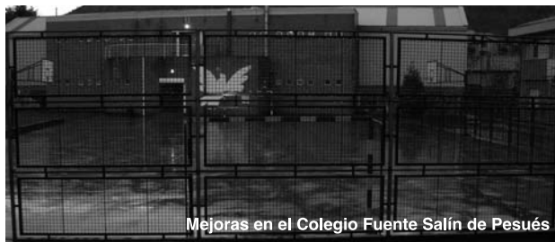
Mejoras en el Colegio Fuente Salín de Pesués

El pasado mes de noviembre se concluyeron las obras de reparación de las mallas de las pistas polideportivas de Unquera y del colegio Fuente Salín de Pesués. Con esta obra, ya concluida a la que el Ayuntamiento de Val de San Vicente ha destinado la cuantía de 9500 euros, se ve cubierta una de las necesidades más demandada por el equipo directivo del Colegio Fuente Salín como por el coordinador de deportes municipal.