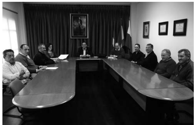
Reunión del cierre de campaña de saneamiento ganadero

Esta comisión se reúne anualmente aunque este año, por motivos de cambios de fecha, se ha reunido en dos ocasiones en el Ayuntamiento de Val de San Vicente.