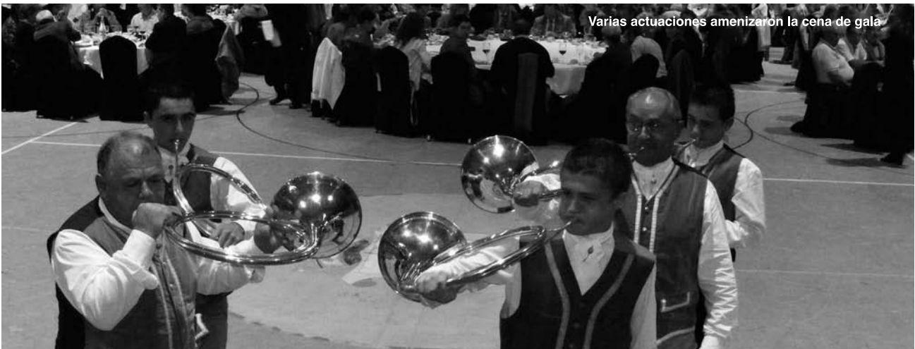
Varias actuaciones amenizaron la cena de gala

Así que con esta reflexión de presente y futuro, quiero destacar los muchos lazos que desde hace diez años hasta hoy se han materializado, y desde la Corporación de Val de San Vicente nos comprometemos, sin duda, al igual que nuestros hermanos de la Corporación de Mios, a seguir estrechando los lazos existentes y a generar muchos más.