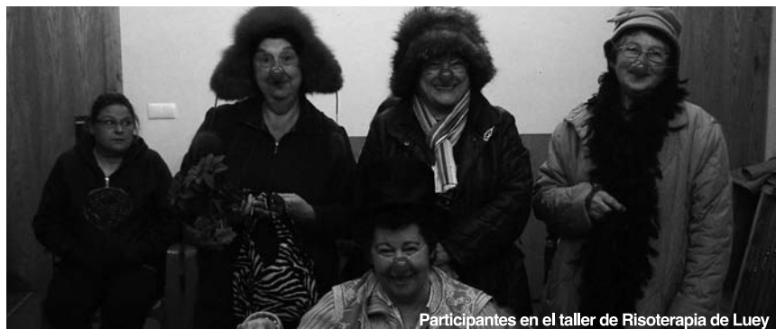
Participantes en el taller de Risoterapia de Luey

Lugar: Centro Cultural Horario: 16.30h a 19.30h Martes 7: Risoterapia Jueves 9: Video fórum Viernes 10: Taller medio ambiente