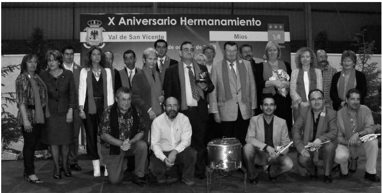
Autoridades asistentes a la cena de gala del X aniversario del hermanamiento entre Mios y Val de San Vicente

Los actos se celebraron en Val de San Vicente con numerosos participantes, el pasado mes de octubre.