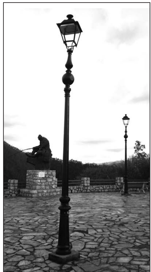
Nuevas Farolas en el mirador de Pechón

Con todo ello, los aspectos más destacables de esta actuación quedan perfectamente reflejados en la obtención de un ahorro de energía de 411.366 Kwh al año, lo que supone una reducción de emisión de 395,53 toneladas de CO 2 a la atmósfera y un ahorro económico, calculado a precios actuales de la energía, superior a 55.000 € anuales.