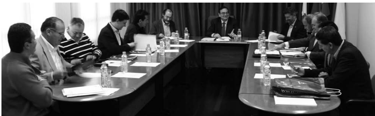
Los Alcaldes de la Comisión de Deportes de la Federación Española de Municipios se reúnen en Val de San Vicente

Entre los asistentes se encontraban los alcaldes del Ayuntamiento de Boadilla del Monte (Madrid), Becerril de Campos (Palencia), Isla Cristina (Huelva), Navia (Asturias), Daimiel (Ciudad Real), Valtierra (Navarra), Bahabón (Valladolid), Guadalix de la Sierra (Madrid), Quinto (Zaragoza) o Guadalajara (Castilla la Mancha)