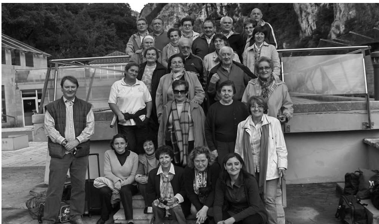
Grupo de participantes en programa de Termalismo.

El Ayuntamiento de Val de San Vicente en colaboración con el Balneario de La Hermida, ofertó a todos los vecinos del municipio la posibilidad de participar en el programa de Termalismo para el otoño de 2010