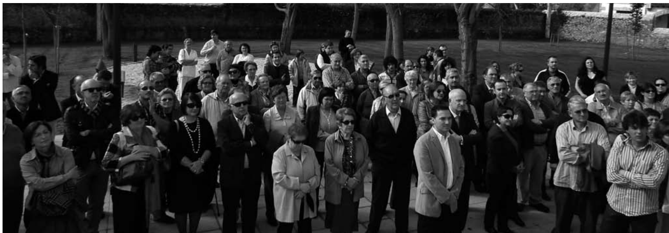
Panorámica de los muchos asistentes al acto inaugural

Las obras, que han sido financiadas por la Consejería