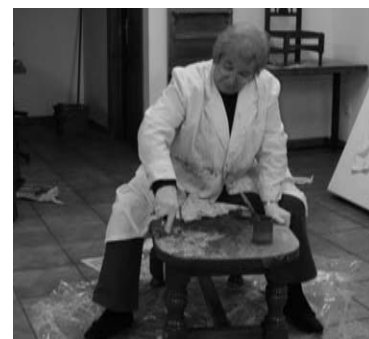
Taller de restauración

En el local del centro cultural el salón de Pechón, están realizando actividades de todo tipo, como; taller de restauración y tapizado, curso de pintura, taller de manualidades, curso de bailes, taller de psicomotricidad, “banco de tiempo Momo” y talleres de automaquillado.