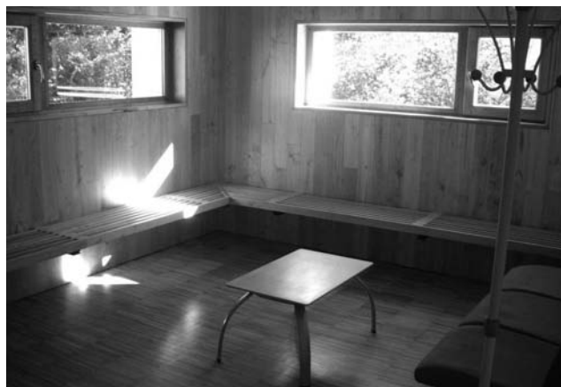
Las nuevas instalaciones cuentan con unos acogedoras estancias para los momentos de duelo

El Ayuntamiento pretende para este próximo año 2011, asfaltar el camino que parte de centro del pueblo de Molleda al cementerio para evitar el paso por la carretera nacional.