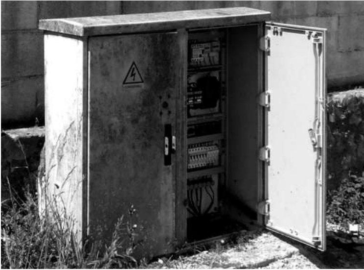
Situación inicial y final del cuadro de alumbrado público en los Tánagos (Royal II)