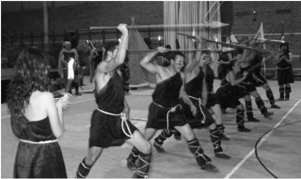
Actuación del Grupo de Danzas La Robleada de Puente San Miguel

Tras el almuerzo, los representantes de Mios conocieron algunos de los lugares más representativos de la comarca, como son, el Soplao, la Torre de Estrada o la Cueva del Pindal.