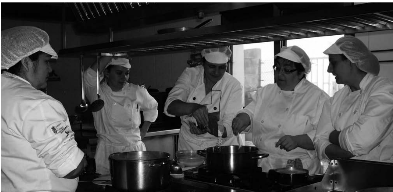
Alumnas del taller de empleo de cocina.

Compuesto por un total de 7 alumnas trabajadoras, durante un año han recibido una formación teórico-práctica en las artes culinarias con un total de 1920 horas impartidas.