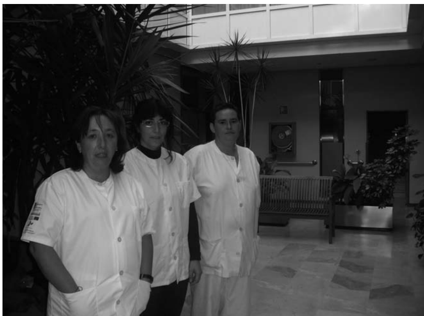
Alumnas taller de empleo técnico socio sanitario

La importancia de cuidar a nuestros mayores, un proyecto promovido por la mancomunidad de los Valles de San Vicente.