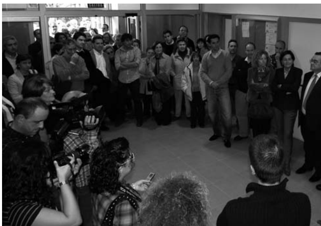
El director del centro presenta al profesorado y muestra las instalaciones.