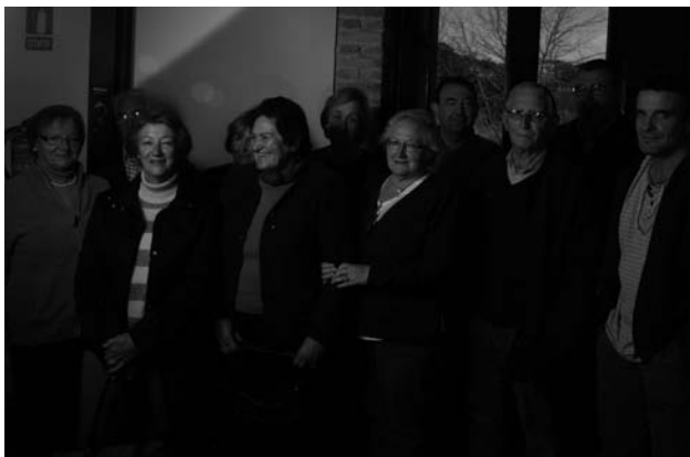
Participantes en el curso de informática

La duración de los cursos es mensual y están dirigidos a personas de todas las edades que estén interesadas en el aprendizaje del uso de las nuevas tecnologías. En el primer curso realizado en este trimestre, los asistentes al mismo se familiarizaron con el uso del ordenador y actualmente están aprendiendo el uso de Internet y el Correo Electrónico.