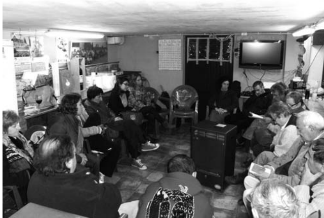
Reunión de la Asociación Lúdico Cultural los Cabreaos