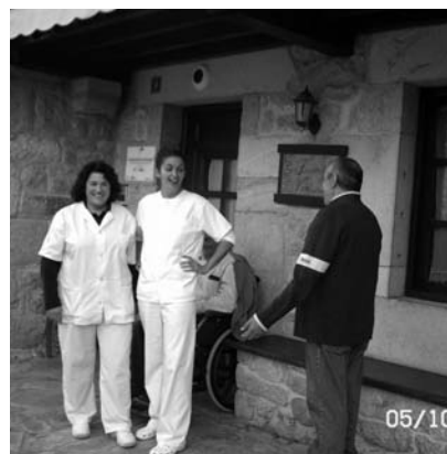
Prácticas de las alumnas del taller de empleo

Todas estas enseñanzas teórico-prácticas han sido complementadas con su correspondiente periodo de prácticas laborales, primero en las residencias de Luey, Comillas y San Vicente de la Barquera y posteriormente en las diferentes empresas de Ayuda a Domicilio que trabajan en nuestro entorno. El Taller de Empleo promovido por la Mancomunidad de los Valles de San Vicente ha dotado y preparado a siete mujeres, para el ejercicio de una profesión emergente, que se encuentra dentro de los nuevos yacimientos de empleo con más futuro en el ámbito de la atención sociosanitaria y los servicios socioculturales y a la comunidad.