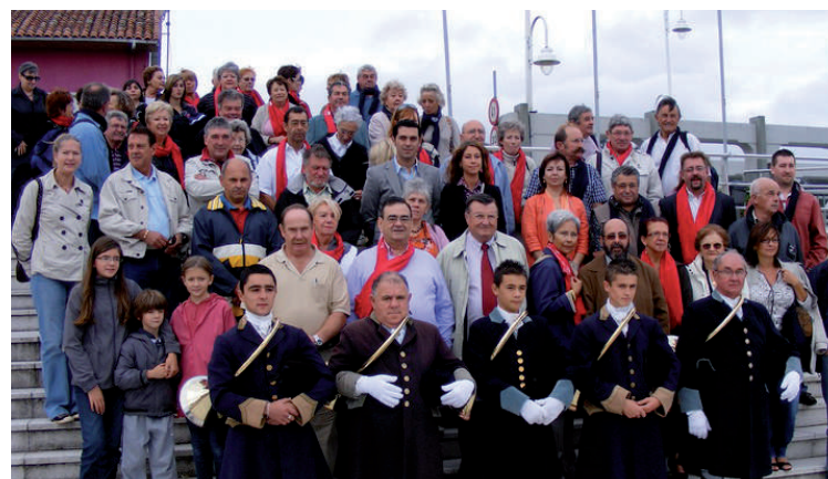
10 Aniversario del Hermanamiento con Mios