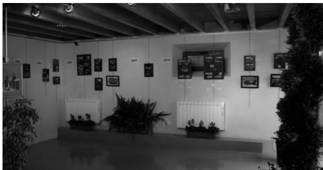
Exposición sobre Mios

Durante este último trimestre, en la Sala de Exposiciones de la Casa de Cultura se han desarrollado varias exposiciones. Comenzamos en Octubre con la parte final de la exposición con motivo del tercer aniversario de la inauguración del Observatorio Astronómico de Cantabria.