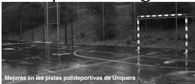
Mejoras en las pistas polideportivas de Unquera