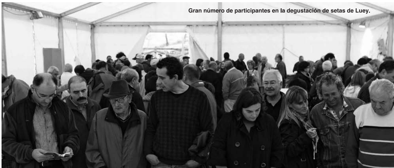
Gran número de participantes en la degustación de setas de Luey.

Las jornadas, que contaron con una amplia participación, se celebraron el pasado mes de noviembre.