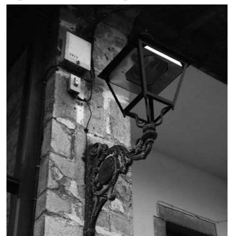
Nuevas luminarias en Moñorrodero.