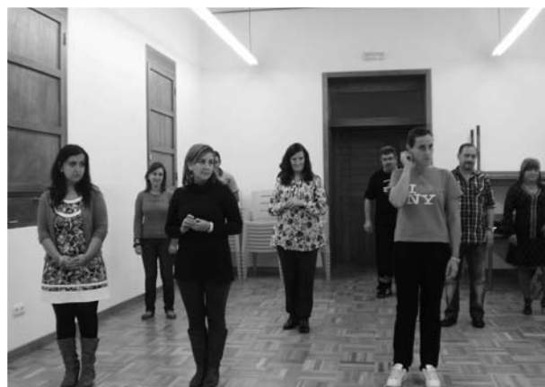
Alumnos del curso de bailes de salón en Prellezo

Además del cierre de año ya están preparando las actividades para el nuevo año donde continuarán con los cursos actuales y debido al éxito obtenido este año se repetirá el curso de manualidades. Además, también está previsto realizar un curso de restauración de muebles. Dentro de las actividades que se van a realizar durante el primer trimestre de 2.011 cabe destacar la organización de la II Cabalgata de Reyes en Prellezo y la fiesta de Santa Eulalia el día 12 de febrero.