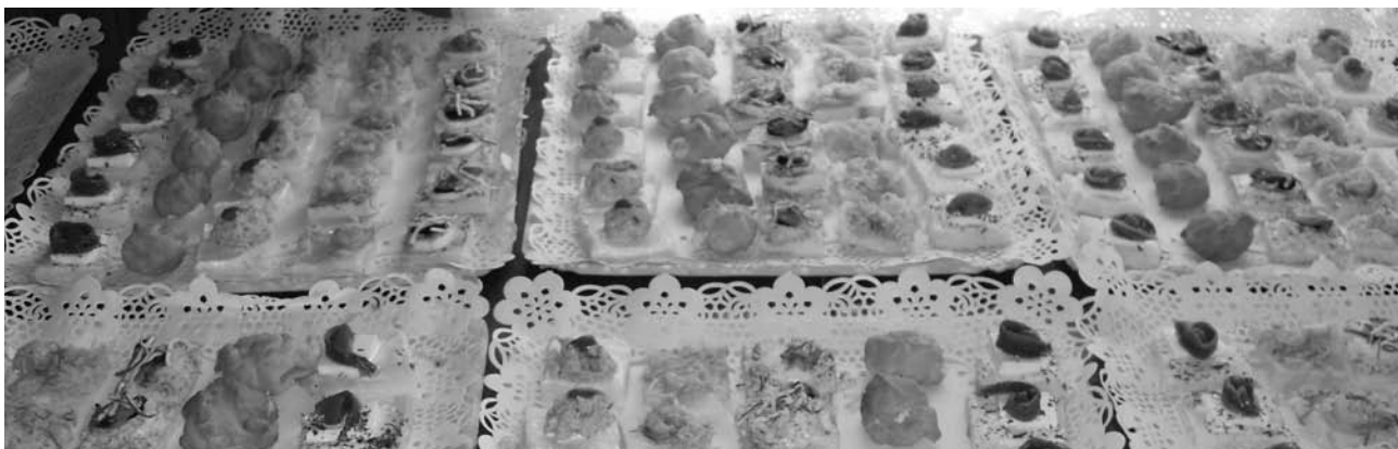
Canapés realizados por las alumnas del taller de empleo.

En el caso de Val de San Vicente, la exposición estuvo abierta en la Casa de Cultura Villa Mercedes y se organizaron actos además para mantener reuniones con el sector hostelero, con el objeto de promocionar el empleo de las alumnas-trabajadoras del taller de cocina.