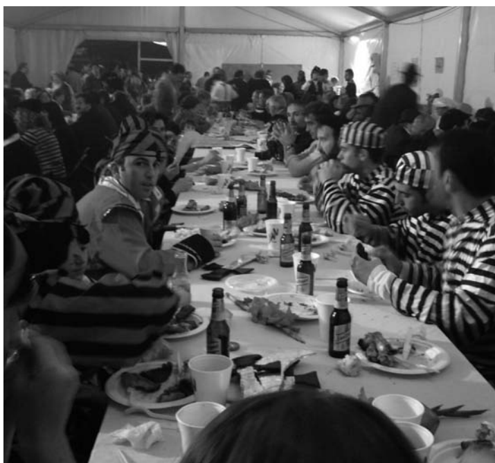
Celebración de la fiesta de la sombrilla

Luey consolida un año más la tradicional fiesta de La Sombrilla, que rememora una fiesta recuperada tras muchos años por la asociación Fuenteventura. La celebración tuvo gran éxito de participación, llegándose a repartir más de 250 cenas, que consistieron en una parrillada popular al precio de 5 euros.