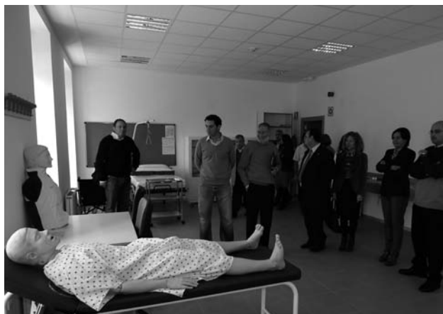
Las autoridades visitan el interior de las nuevas instalaciones del centro de educación Postobligatoria de Unquera.

de Educación del Gobierno de Cantabria, han rondado los dos millones de euros, y para la obtención de los terrenos fue necesaria la compra del inmueble y su finca al obispado, por una cantidad de 780.000 euros que fueron pagados a medias entre la Consejería de Educación y el Ayuntamiento de Val de San Vicente.