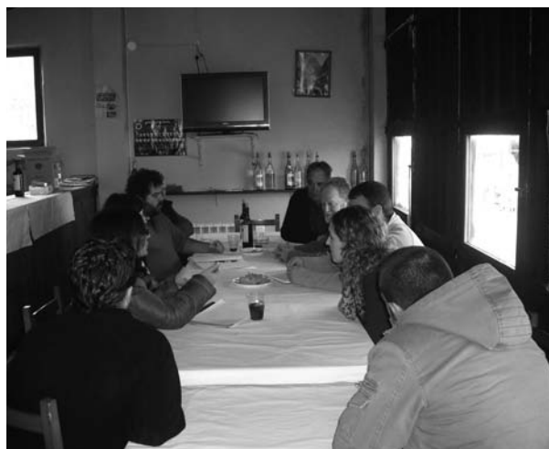
Reunión de Asociaciones 2010