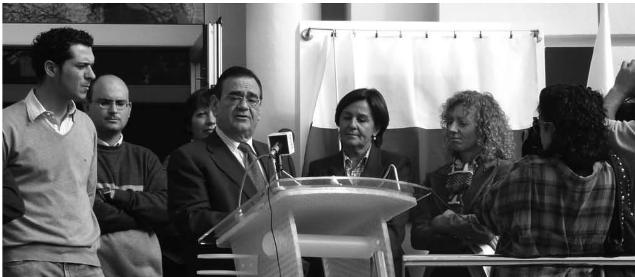
Las autoridades dando sus discursos inaugurales.