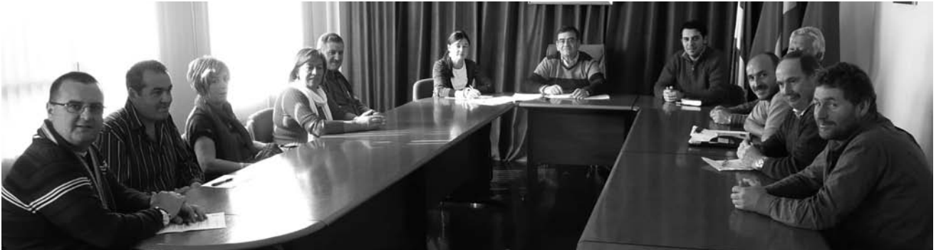
Miembros del Consejo de Juntas Vecinales