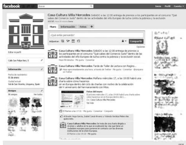
Vista del perfil de Facebook de la casa de cultura

(200 millones) concentran un gran potencial para llegar a las personas. Si bien ambas redes pertenecen al grupo de las redes sociales la mayor diferenciación entre una y otra, está en que sitios como Twitter, usan el modelo de suscripción o seguimiento (follow), por ende el contenido es público, mientras que en sitios como Facebook usan el modelo de amigo (de ida y vuelta) y por esa razón el contenido tiende a ser privado.