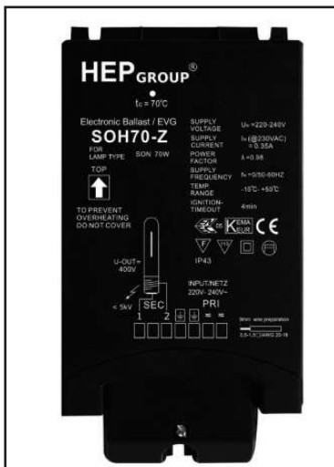
Balastos electrónicos y nuevas luminarias, suponen ahorro energético

El Ayuntamiento de Val de San Vicente, apoyándose en el nuevo Fondo Estatal para el Fomento del Empleo y la Sostenibilidad, más popularmente conocido como Plan E 2010 e impulsado por el gobierno de la nación,