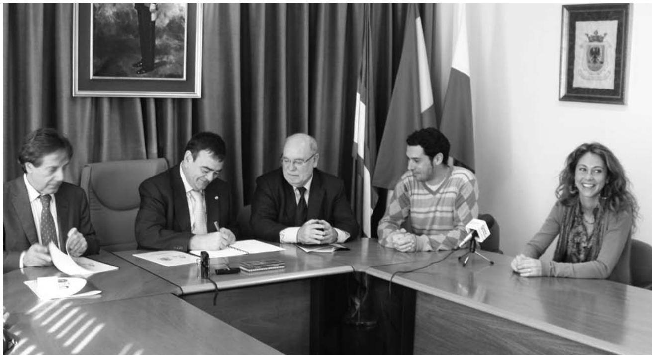
El Alcalde firma el convenio con el Consejero de Industria y el Presidente de FEVE.

El Consistorio agiliza los trámites para el próximo inicio de las obras de la estación de autobuses de Unquera, que además reordenará el tráfico con la construcción de una glorieta.