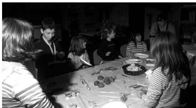
Taller infantil Europa

El jueves 16 de diciembre se clausuró el Taller de Lectura de Val de San Vicente. Formado por 19 lectoras y un coordinador, este taller se realizó por quinto año consecutivo, con periodicidad semanal y dos horas por sesión. El grupo se reunía en la sala bajo cubierta de la Biblioteca Municipal (Casa de Cultura) y dio comienzo en este 2010 a mediados del mes de marzo, interrumpiéndose los meses de verano para volver a retomarse en los primeros días del mes de septiembre. En esta edición se han leído once títulos de diferentes autores, además se han realizado lecturas de obras de Miguel Delibes, Miguel Hernández y Mario Vargas Llosa, conmemorando así la muerte, el centenario del nacimiento, y la concesión del premio Nobel, respectivamente, de estos escritores.