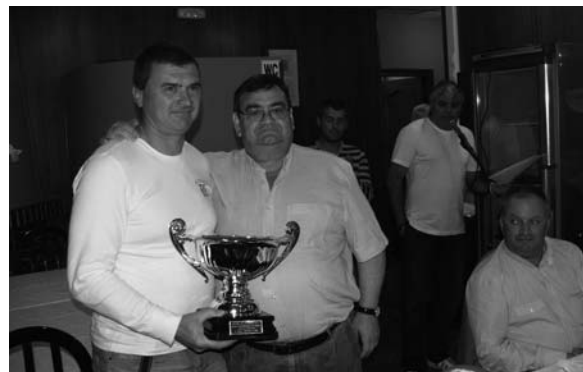
el alcalde entregando el trofeo al campeón de liga: Piensos Cano