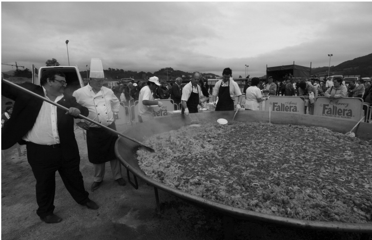
Paella que degustaron los asistentes a la feria.