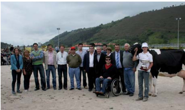
Éxito de la feria de ganado