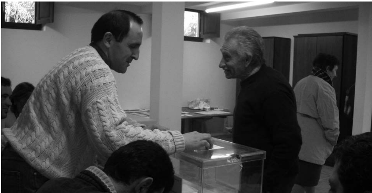
Un vecino ejerce su derecho al voto.

El Partido Socialista Obrero Español (PSOE) ganó las elecciones en el Ayuntamiento de Val de San Vicente, en una jornada caracterizada por la ausencia de incidencias y la alta participación. Los socialistas superaron en más de 100 votos al partido popular, 907 votos por 803 de los populares. El índice de participación fué del 81%. Las votaciones se de-