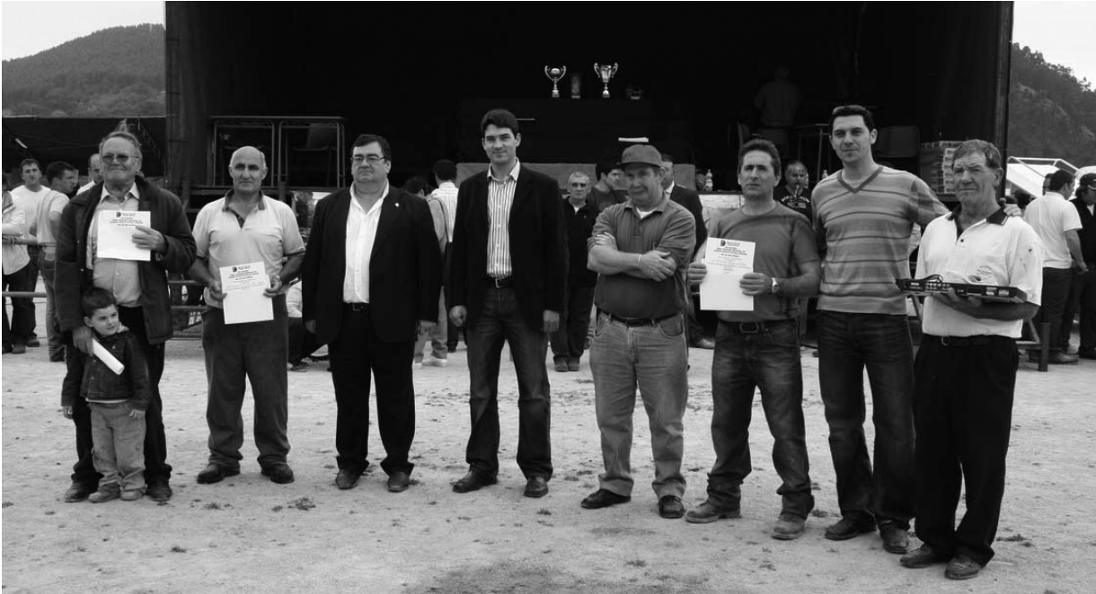
Autoridades con los ganadores de los premios especiales por participar más años en la feria.

El municipio de Val de San Vicente acogió recientemente la vigésimo quinta feria de ganado. Una vaca de nombre 'Bruna', de la SAT Ceceño, de El Tejo, revalidó el título de gran campeona del Concurso Regional de Ganado Vacuno Selecto de Raza Frisona celebrado en los Campos del Llance, de Unquera. El certamen estuvo organizado y patrocinado por el Ayuntamiento de Val de San Vicente. Un certamen de alto nivel que este año cumple