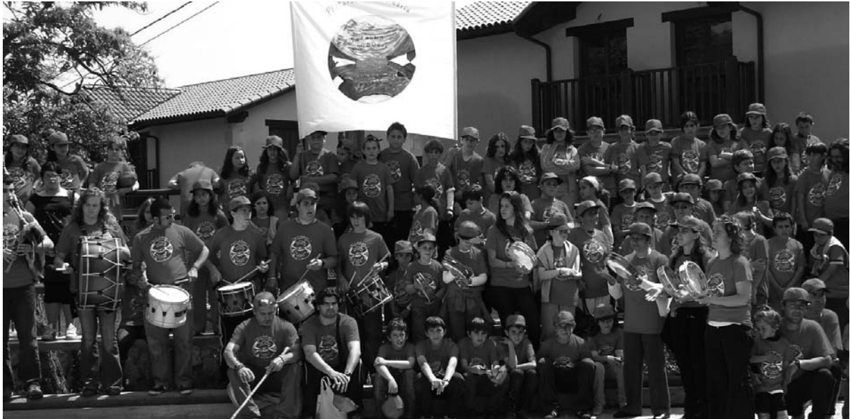
Grupo de los participantes en la marcha solidaria.

Un año más la Plataforma Solidaria Val de San Vicente ha organizado, en el Colegio Público Fuente Salín y el polideportivo municipal de la localidad de Pesués, el “X Fin de Semana Solidario”, que como todos ya sabemos tiene como objetivo recaudar fondos para seguir mejorando las condiciones de vida de la zona de La Ceiba en Honduras, que en el año 1998 quedó literalmente arrasada a causa de los efectos del huracán Mitch.