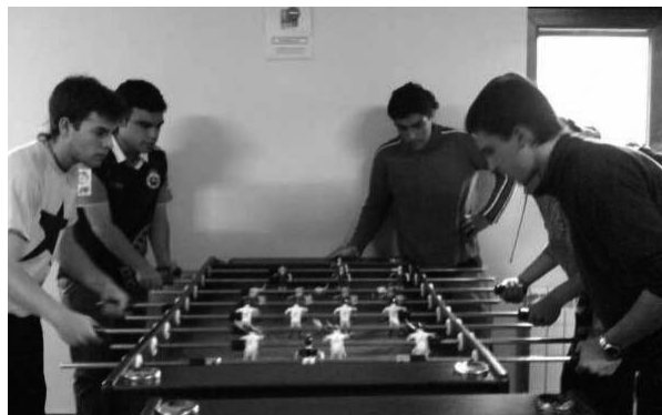
Jóvenes jugando al futbolín.