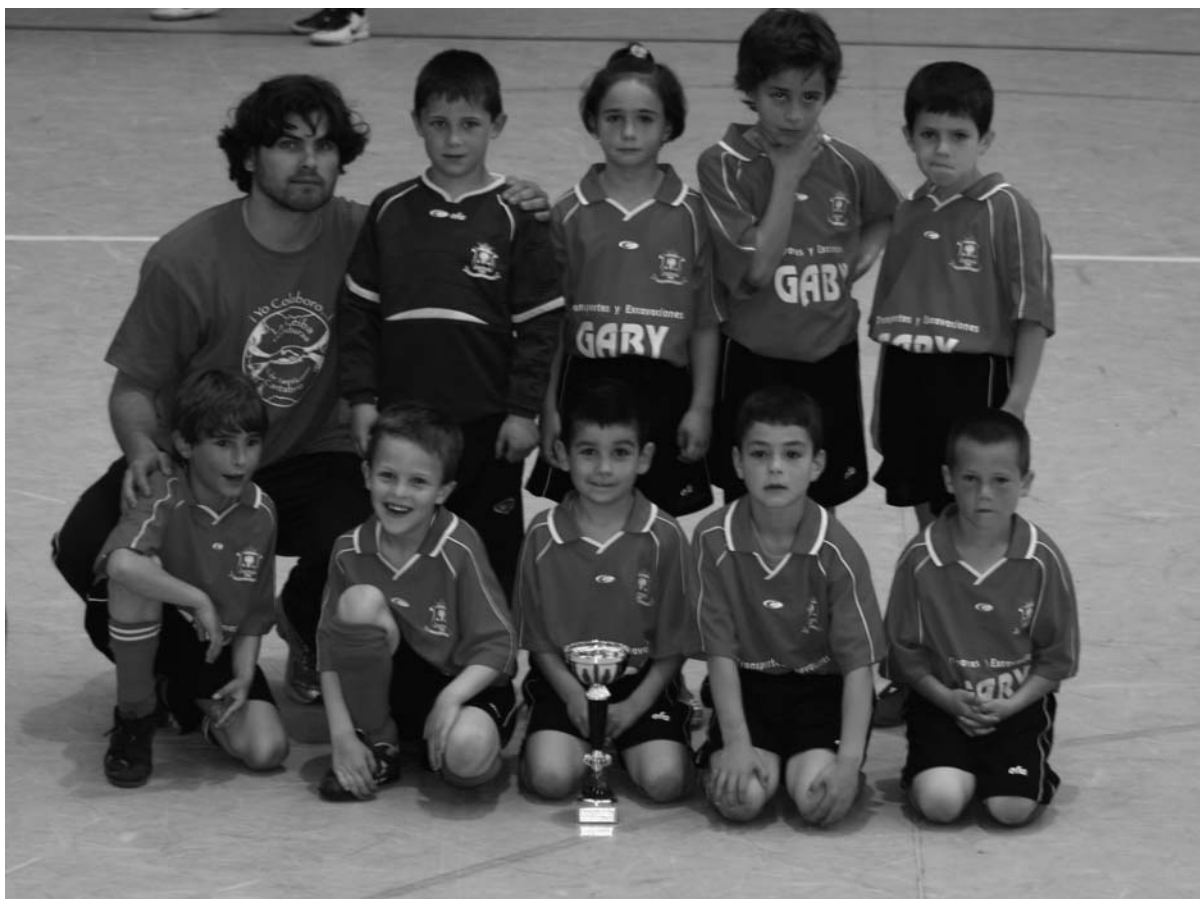
Imágenes de los categorías inferiores de fútbol sala.

El pasado 10 de mayo finalizó la competición de fútbol sala para los equipos de categoría prebenjamín, benjamín y alevín del CDE Fuente Salín.