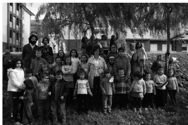
Grupo de participantes en las actividades del día del libro.