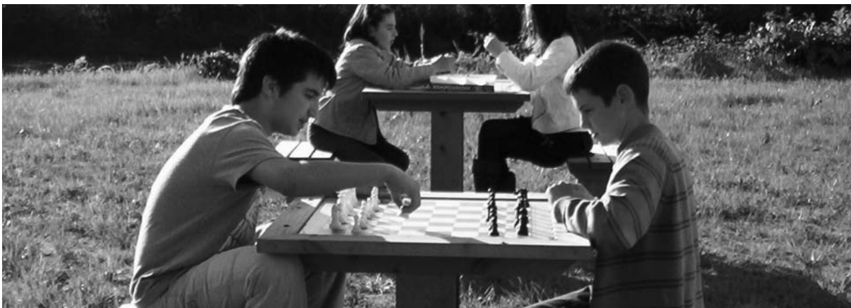
Jóvenes jugando al ajedrez en la zona exterior

El pasado 16 de abril se abrió al público la Casa de la Juventud, que está ubicada en el antiguo edificio de la Casa del Guarda Mayor (guardarríos) que, posteriormente, fue el Consultorio Médico de Val de San Vicente. El alcalde de Val de San Vicente, Miguel Ángel González mostró su