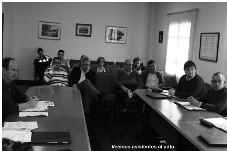
Vecinos asistentes al acto.