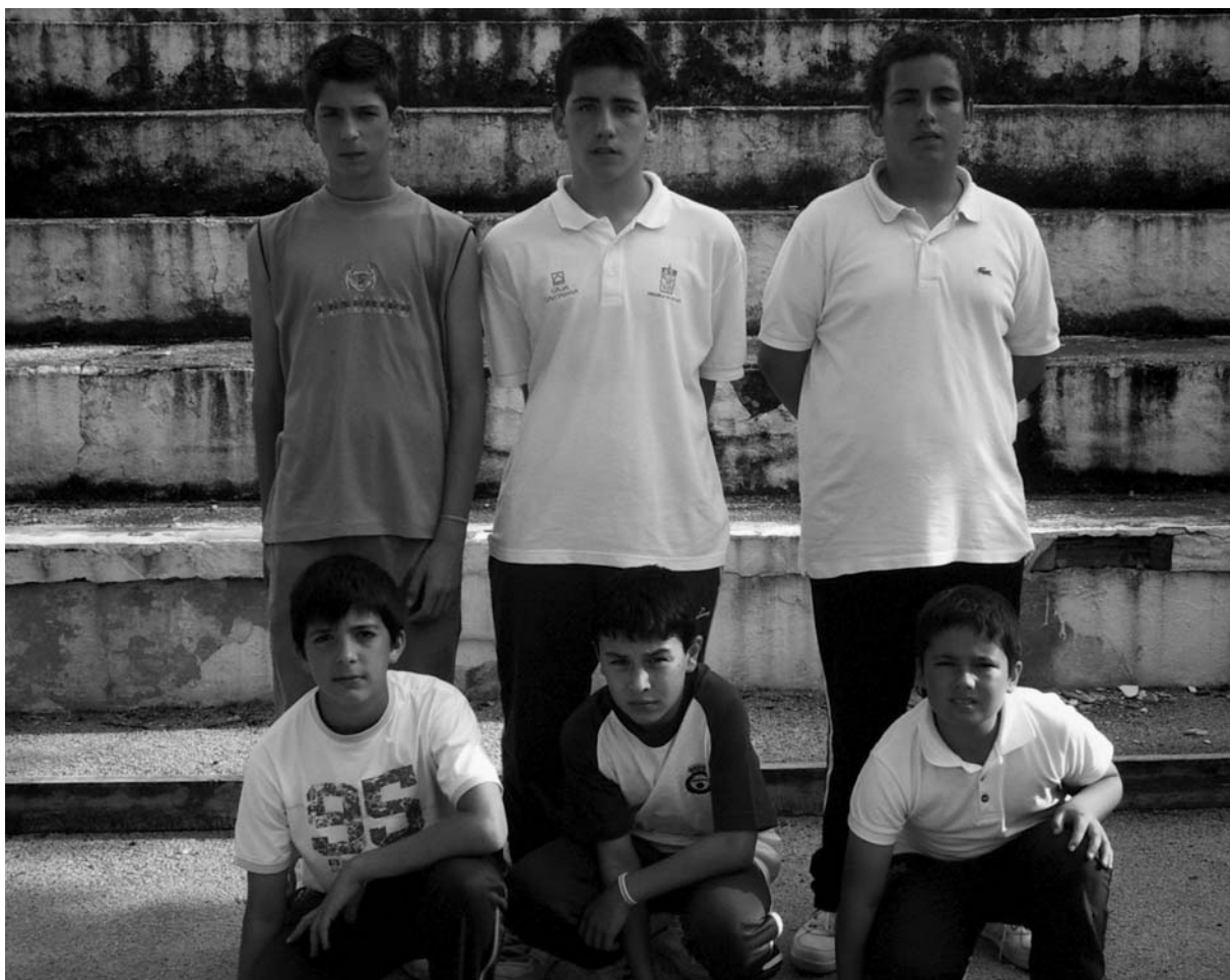
E.B Infantil Val de San Vicente