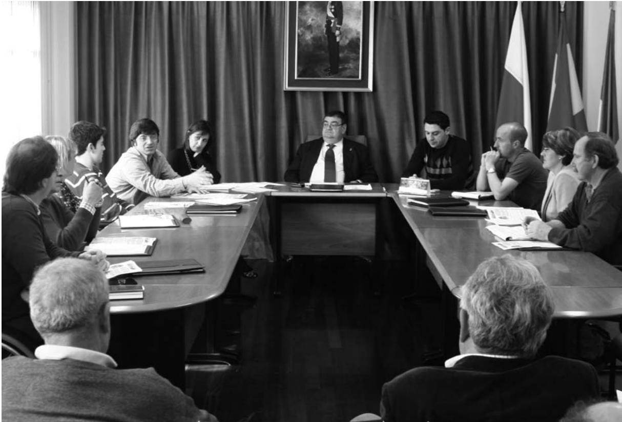
Foto del consejo de participación