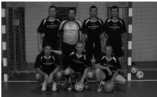
De Café La Cambera (primer equipo de Val de San Vicente)