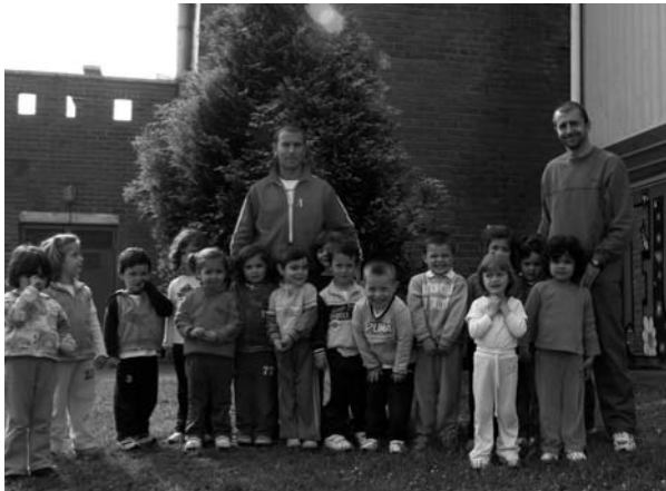
Alumnos de 3 años con los profesores de Educación Física

para que sea un recurso puntual y rápido para buscar información en Internet y usarla en clase. Por otra parte, ciertos contenidos de Matemáticas, Lenguaje y Conocimiento del Medio se trabajan directamente en el aula de informática con todo el grupo.