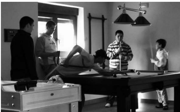
Jóvenes jugando al billar

satisfacción por la participación de los jóvenes y aseguró que el horario de la instalación será de 17 a 21 horas todos los días de la semana, excepto los lunes y martes por descanso. No obstante, el Ayuntamiento está estudiando la posibilidad de poder abrir todos los días durante el verano.