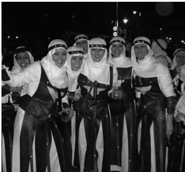
Tercer clasificado, 'Indús'

para el grupo 'Bebe-dores'; el tercero con 100 euros para los 'Indús' y el premio a la mejor carroza fue para Discoteca Pacha, quien recibió 150 euros.