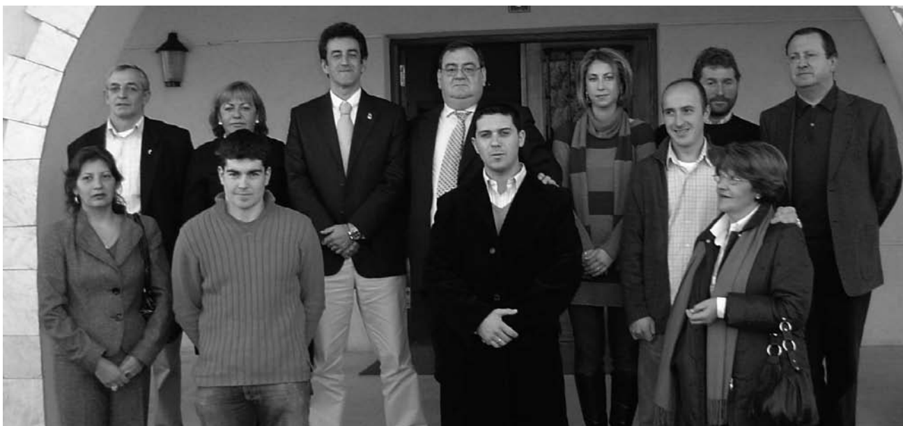
Foto de grupo en el Ayuntamiento de Val de San Vicente.

El alcalde destacó como obra estrella el saneamiento de las rías de Tina Mayor y Tina Menor que ya ha comenzado. Con esta actuación se producirá el saneamiento integral de todos los pueblos con la depuradora que irá ubicada en la Tejera (Pesúes), con capacidad para 15.000 habitantes. Además, recoge el saneamiento de Bustio. Aprovechando la visita del consejero, el alcalde le solicitó que se amplíe la depuradora de Pechón durante la época estival, así como una ayuda para un proyecto de redes pluviales en Unquera y de recuperación ambiental en Pechón y Muñorrodero, respectivamente.