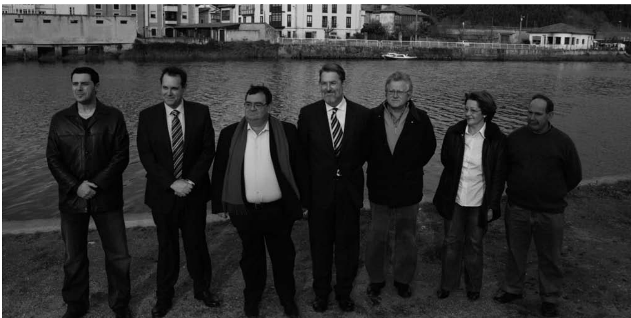
Ibáñez visitó el paseo fluvial junto al alcalde

La actuación afecta a una franja de 255 metros lineales frente al río