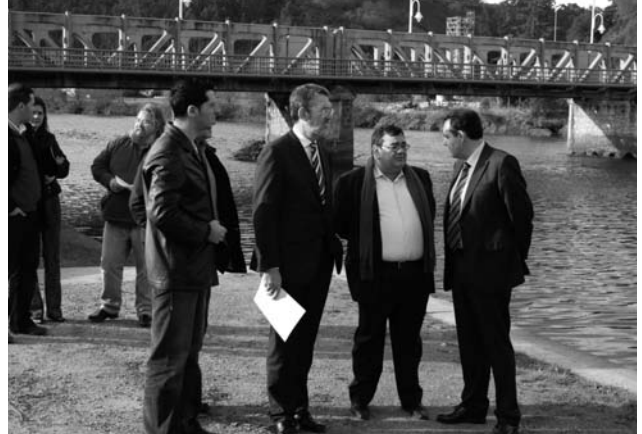
Foto de grupo de autoridades durante la visita del delegado del Gobierno.

La empresa Aldesa, adjudicataria de las obras de construcción del nuevo paseo marítimo de la localidad de Unquera ha comenzado la ejecución de las mismas, una actuación que significa una inversión del Ministerio de Medio Ambiente de 974.166 euros. El objetivo de este proyecto es dotar a la fachada marítima de la localidad de Unquera de un nuevo espacio público, abierto a todos los ciudadanos de la localidad, para que sirva de punto de partida de un paseo marítimo que se prolongue hasta la zona de Molleda. En total, se va a actuar sobre una superficie de 10.600 metros cuadrados de espacio costero que a ser recuperado, lo que se traduce en una actuación lineal de 265 metros de costa.