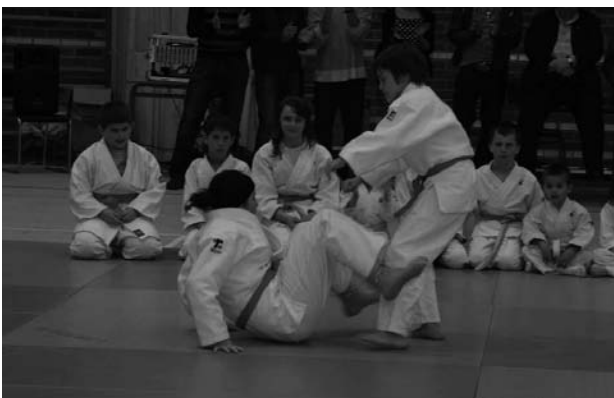
Alumnos de la escuela de Judo.

Cuando se dieron por finalizadas las intervenciones de los niños, todos ellos, así como el resto del público, tuvieron acceso a los jugadores del Racing, que con gran paciencia y mucha simpatía firmaron postales, posters del equipo y todo tipo de objetos que los niños les acercaran, que no fueron pocos.