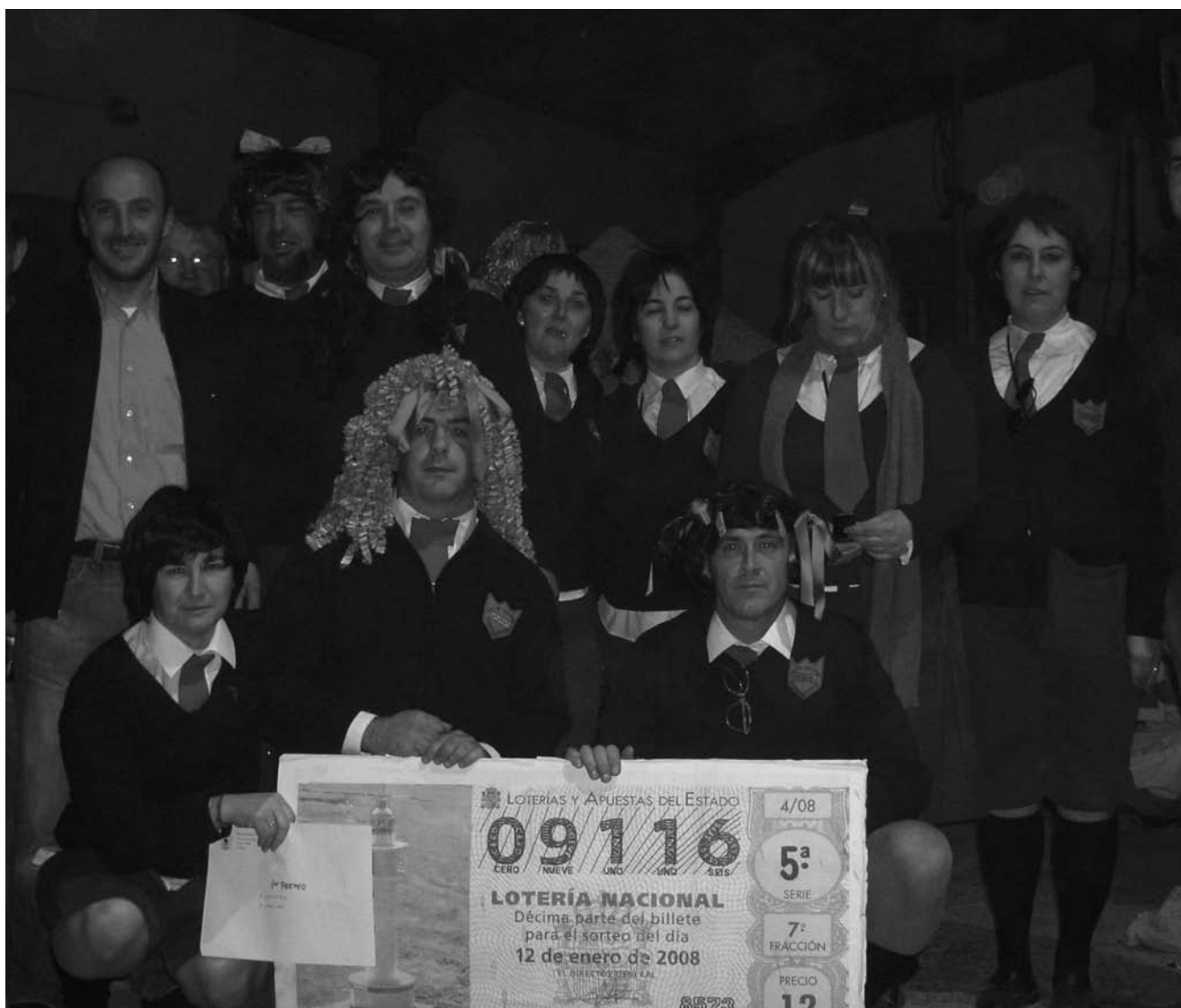
Imagen del grupo ganador del concurso, 'Los niños de San Ildefonso'.

Val de San Vicente celebró su carnaval el pasado 9 de febrero. El programa se inició con el carnaval infantil, a las 16 horas, que partió con un pasacalles amenizado por la Batucada Brasileña 'Afro Sound System' desde la plaza de La Estación, hasta el recinto ferial, donde disfrutarán de una tarde con espectáculos de circo, magia y malabares, para finalizar con una actuación musical infantil a cargo del grupo 'El capitán maravilla'. A las 21 horas se inició el desfile de los mayores desde