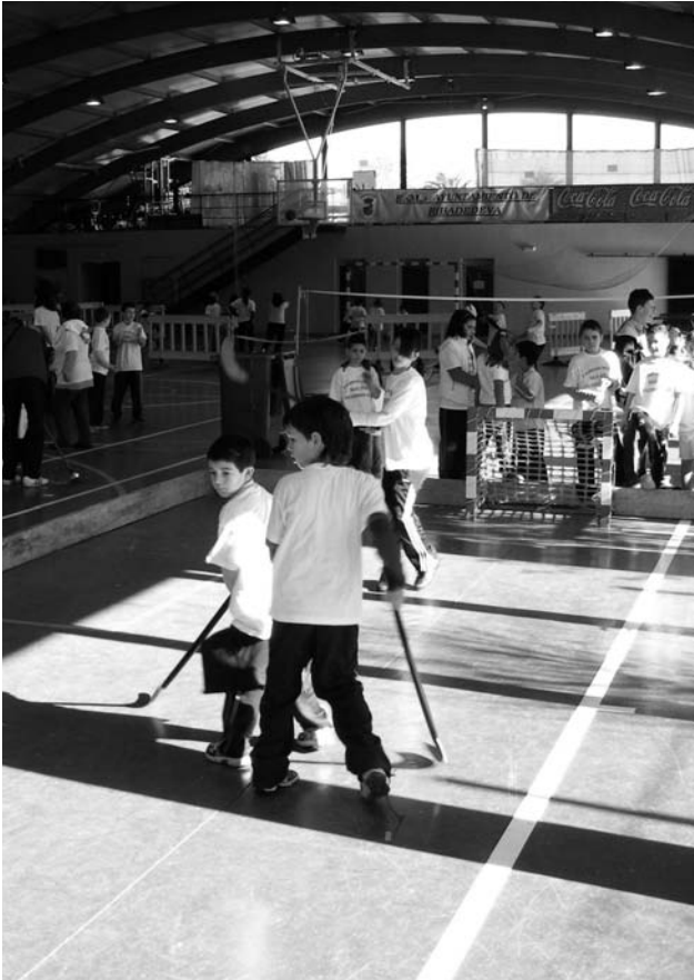
Foto de grupo de participantes.

Después de coger fuerzas con un buen avituallamiento, cortesía también de la organización, se reanudaron los partidos, los juegos y los pequeños “piques” en todos y cada uno de los juegos propuestos a los que se añadieron carreras de sacos, tiro de cuerda, salto a la comba y otros juegos, con la ayuda de monitores y de un grupo de madres que ayudó a la organización uniéndose a la fiesta y que hicieron que los niños no se quisieran ir