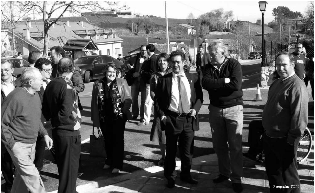
Revilla y el alcalde de Val de San Vicente y varios miembros de la Corporación municipal en Abanillas.

la mejor de España", con viales "muy bien hechos y para enseñar". En su opinión, una buena carretera tiene que ser "segura para turistas y ciudadanos, y respetuosa con el entorno", cualidades en base a las cuales Cantabria está completando "una red sobresaliente".