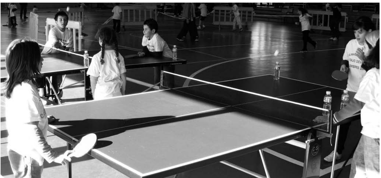
Jugando al ping-pong

Como prueba de la gran acogida que tienen este tipo de eventos, cabe reseñar que una vez más se han superado los 130 presentes que seguro vuelvan el año que viene a acompañarnos, ya que visto el éxito de las dos ediciones realizadas esperamos que este evento se consolide en el tiempo.