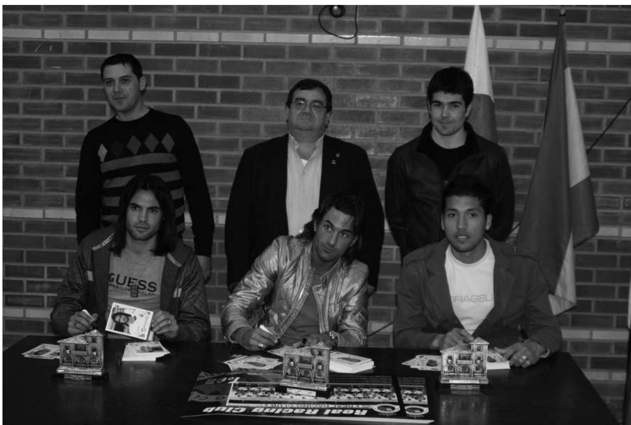
Foto de autoridades con los tres jugadores del Racing.