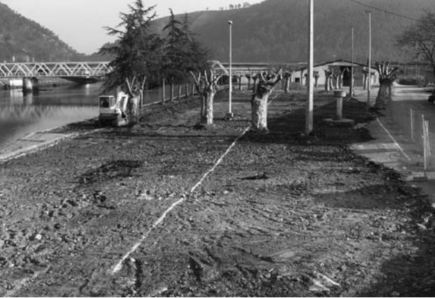
Comienzo de la obras.