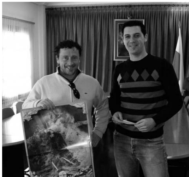
El primer teniente del alcalde Entrega el premio al ganador del Cartel Carnaval 2008

para el grupo 'Bebe-dores'; el tercero con 100 euros para los 'Indús' y el premio a la mejor carroza fue para Discoteca Pacha, quien recibió 150 euros.