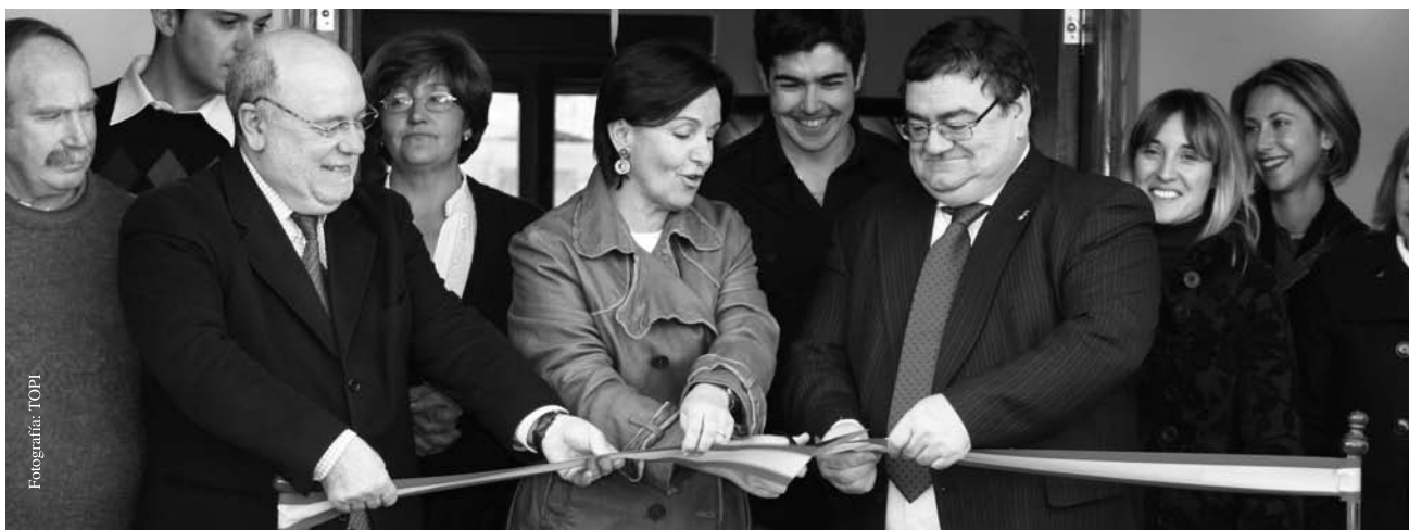
La Consejera, el Director General de Cooperación Local, El Alcalde, La Directora de Juventud y Concejales

Esta nueva infraestructura ha supuesto una inversión de 130.000 euros y da respuesta al crecimiento de jóvenes que está experimentado Unquera