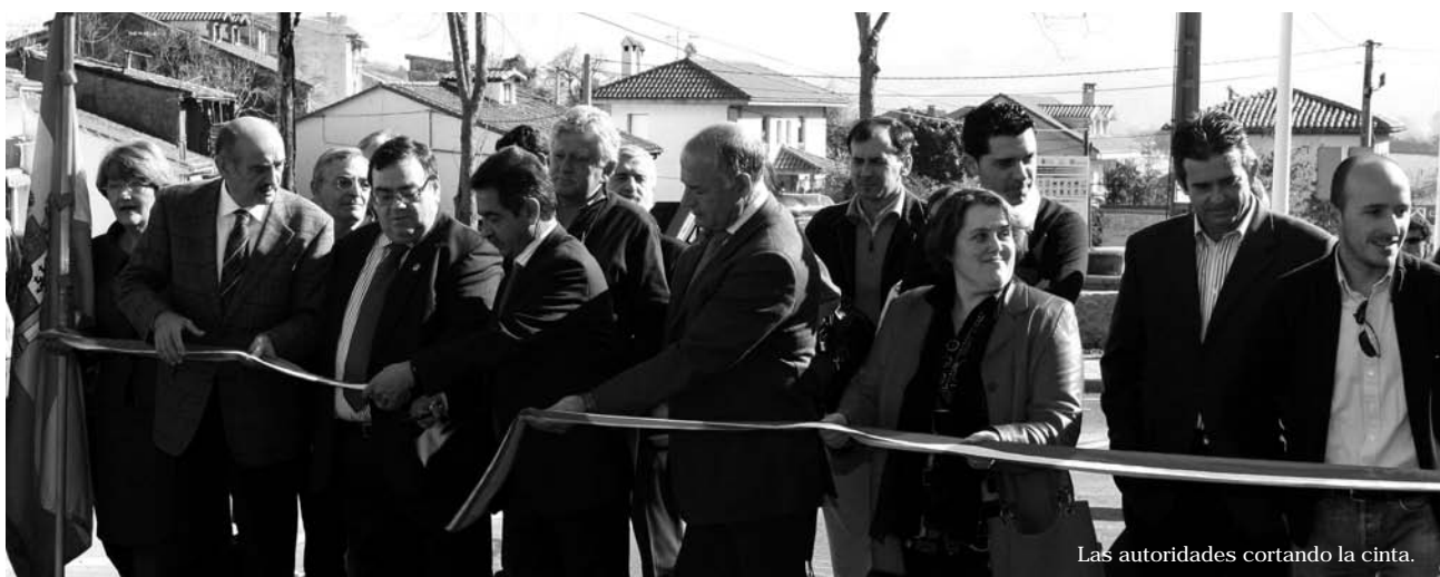
Las autoridades cortando la cinta.