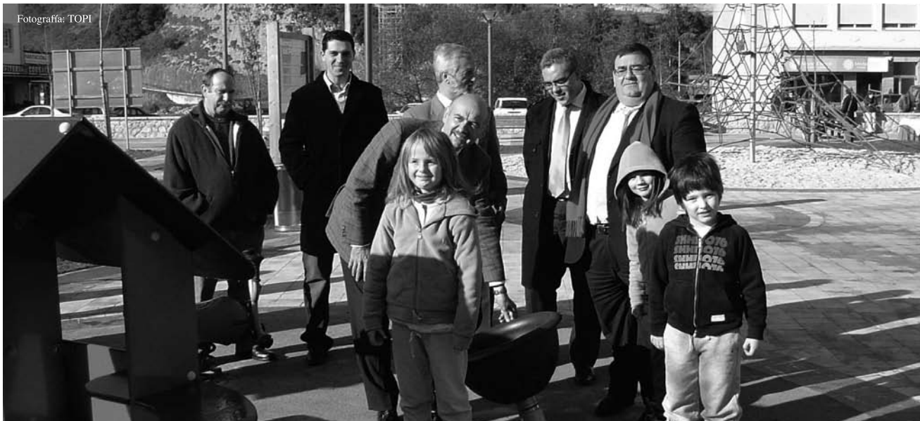
Los jóvenes disfrutando del nuevo parque.

procedido a descubrir una placa conmemorativa de la inauguración, para, posteriormente, recorrer las nuevas instalaciones. En este sentido, el titular de Obras Públicas se mostró "satisfecho" con el resultado de los trabajos, ya que supone la creación de un espacio que "ofrecerá posibilidades de ocio tanto a los pequeños como a los adultos".