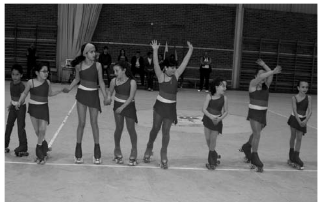
Alumnas de la escuela de patinaje artístico.

Cabe recordar que todas estas actividades se encuentran subvencionadas por el Ayuntamiento de Val de San Vicente, mediante un acuerdo de colaboración con el Club Deportivo Elemental Fuente Salín.