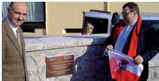
Inaugurado en Unquera el parque y plaza 'Villa Mercedes'