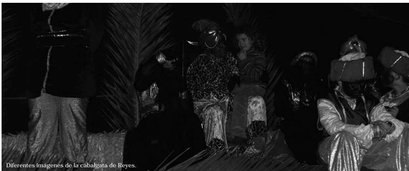
Diferentes imágenes de la cabalgata de Reyes.

Gran éxito de participación en las actividades navideñas