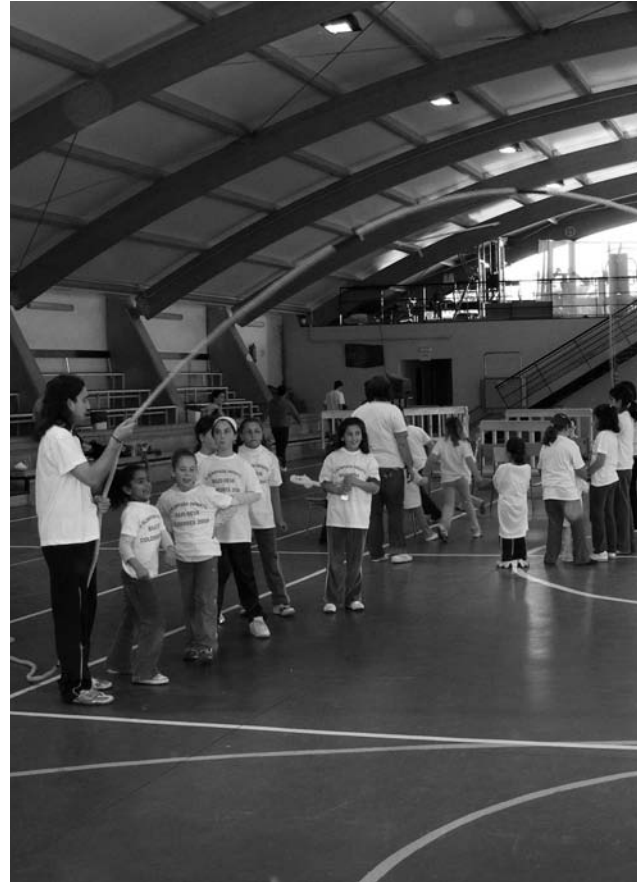
Las chicas se lo pasaron en grande saltando a la comba.

Después de coger fuerzas con un buen avituallamiento, cortesía también de la organización, se reanudaron los partidos, los juegos y los pequeños “piques” en todos y cada uno de los juegos propuestos a los que se añadieron carreras de sacos, tiro de cuerda, salto a la comba y otros juegos, con la ayuda de monitores y de un grupo de madres que ayudó a la organización uniéndose a la fiesta y que hicieron que los niños no se quisieran ir